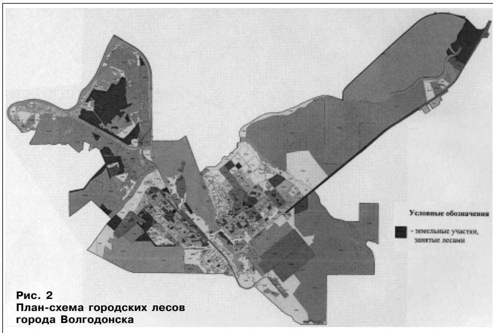
Рис. 2 План-схема городских лесов города Волгодонска

Район расположения городских лесов характеризуется развитой сетью путей транспорта общего пользования.