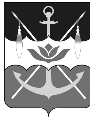
1. Рисунок герба города Волгодонска